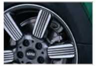
Rin 17" 60 Years Spoke 2-tone.

Equipamiento Exterior. • Faros LED delanteros autoadaptables y traseros con diseño Union Jack. • Líneas en el cofre edición aniversario 60 Years. • Toldo y retrovisores: Pepper White. • Techo panorámico.